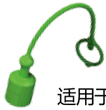
适用于阳接头的防尘帽