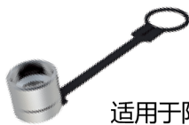
适用于阳接头的防尘帽